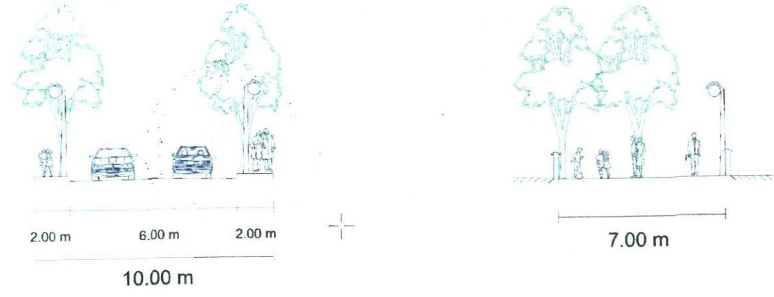
Alan Kullanımı Tablosu